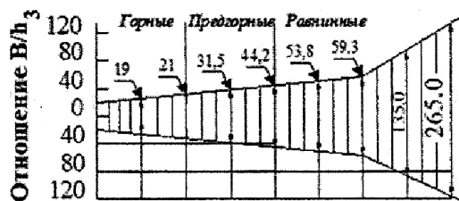
Рис.2. Эгаора изменений В/н по длине реки Сырдарья 38