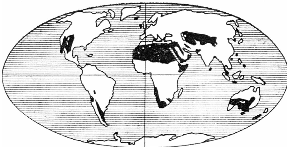
Рис. 1. Распространение аридных территорий в мире. Fig. 1. Distribution of the arid territories in the world.

Общие черты распределения аридных земель по частям света (рис. 1) показывает, что основные масштабы (до 70%) пустынь распространены в центральной и северной Африке, остальная часть – в Евразии, Австралии и на Американском континенте. Динамические изменения за 20-летний период иллюстрируют (табл. 1) заметное увеличение площадей деградированных земель, получили распространение почти во всех аридных регионах. Общая тенденция расширения деградированных и пустынных земель особенно наблюдается в Африке и Евразии, в состав которой входит и территория нашей страны. По данным ФАО ЮНЕСКО, вместе с пашней, пастбищами, лугами человек использует до 25-30% суши, а с продуктивными лесами 50-55%. Остальная часть суши в смысле получения биологической продукции используется человеком недостаточно. Между тем, правильно организованное сельское и лесное хозяйство, высокопродуктивное земледелие смогут обеспечить ликвидацию многих отрицательных явлений и позволят включить в производство большие площади ныне бесплодных деградированных земель. Не менее важное значение имеют процессы загрязнения земель вредными веществами, основные причины которого следующие: во-первых, выпадение из атмосферы тяжелых металлов на обнаженную поверхность мелкозернистых отложений; во-вторых, нарушение установившегося равновесия в химических реакциях в геологической породе, способствующих образованию разнообразных по составу отложений, потенциально являющихся почвообразующими телами.