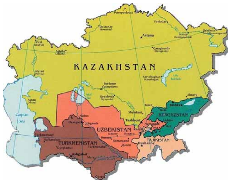
Рис. 1. Страны Центральной Азии

Бассейн Аральского моря расположен в засушливых и полузасушливых зонах и охватывает территорию пяти бывших советских, ныне независимых центральноазиатских республик - Казахстана, Кыргызстана, Таджикистана, Туркменистана и Узбекистана. Северный Афганистан, являющийся одной из самых древних цивилизаций мира, связан с бассейном Аральского моря с гидрологической и этнической точек зрения через развитие водных ресурсов и орошения. Бассейн Аральского моря включает в себя бассейны двух крупных рек Амударьи и Сырдарьи, их притоков и многочисленных малых рек и ручьев, которые в результате интенсивного орошения уже оторвались от главных источников – Амударьи и Сырдарьи (рис. 1).